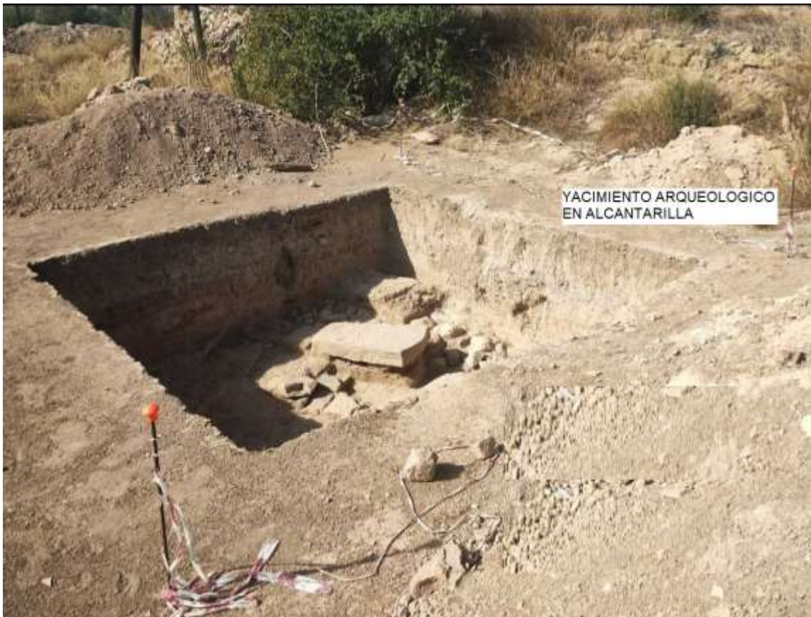
Fotos del estado del Cabezo del Agua Salada