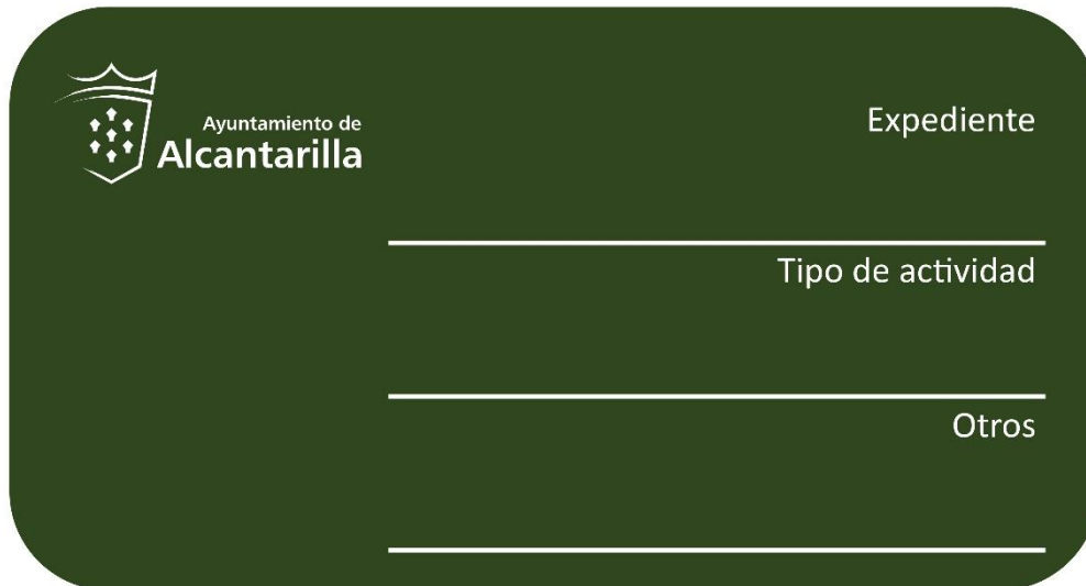
Imagen 3 – Cartel Tipo C.

El tamaño de este cartel es A5 (148,00 mm x 210,00 mm).