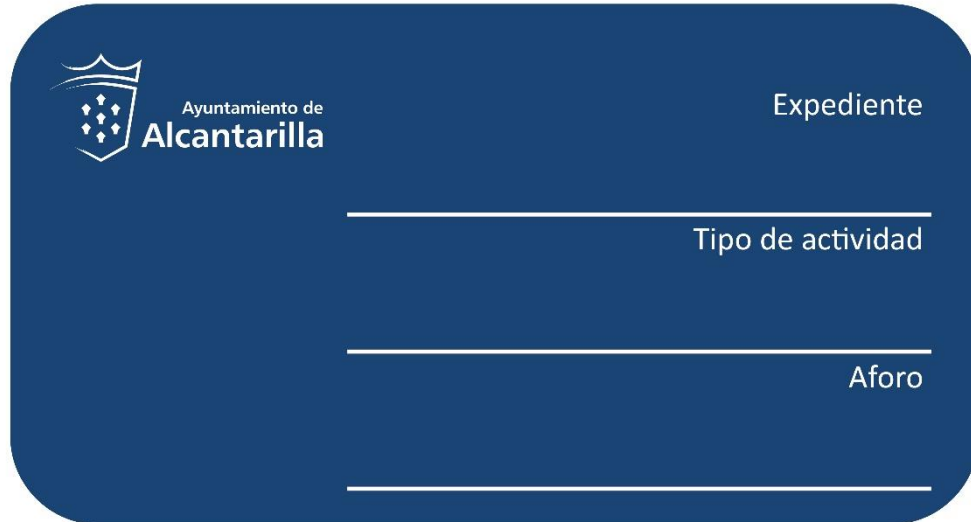
Imagen 2 – Cartel Tipo B.

El tamaño de este cartel es A5 (148,00 mm x 210,00 mm).